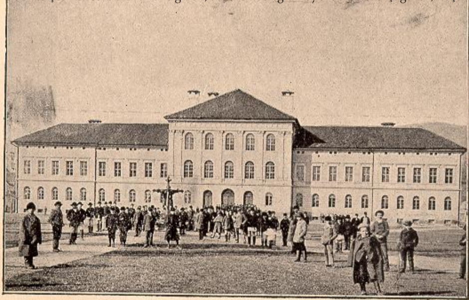
Gimnasiul român gr. or. din Brașov.