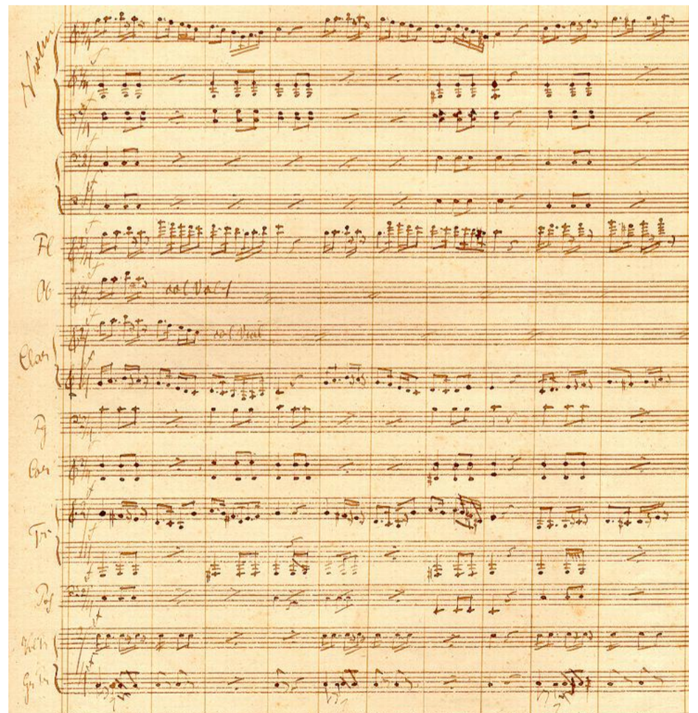
Fragmente din partitura operetei „Crai Nou”, Muzeul Primei Școli Românești, Brașov