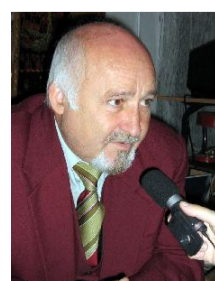
Vasile Oltean, „Crai Nou” în premieră la Brașov acum 130 de ani